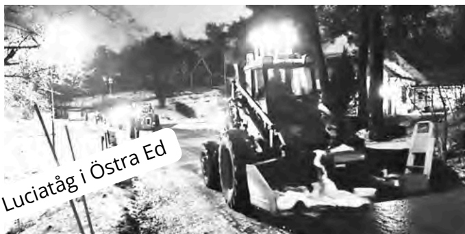
Luciatåg i Östra Ed